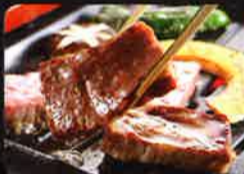
国産牛ロース陶板焼き

※ご予約時にお申し付けください。ご指定の無い場合は焼き物は 牛ロース陶板焼き、小鍋は梅鶏の鋤焼きになります。