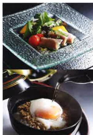
上 アボカド生ハム巻サラダ / 下 牛そぼろ御飯