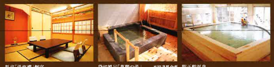
料亭「湯海楼」個室 貸切風呂「萬願の湯」 ※別途料金要 明正館温泉